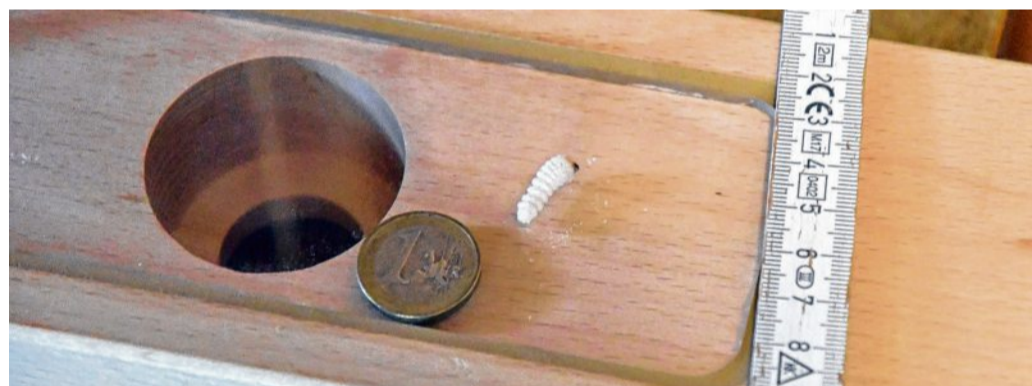
Biologisch wird der Erfolg mit einem Holz-Kontrollblock (hier mit Holzbock) überprüft.

Kulturgut für die Zukunft zu erhalten, ist ein wichtiges Thema für Museen und Kirchen. Gerade historische Gegenstände und Inneneinrichtungen aus Holz werden häufig von Schädlingen befallen. Um dem einen Riegel vorzuschieben, haben sich das Museum Eberswalde und die Evangelische Kirche Uckermark zu einem einzigartigen Projekt zusammengefunden. Es könnte Schule machen.