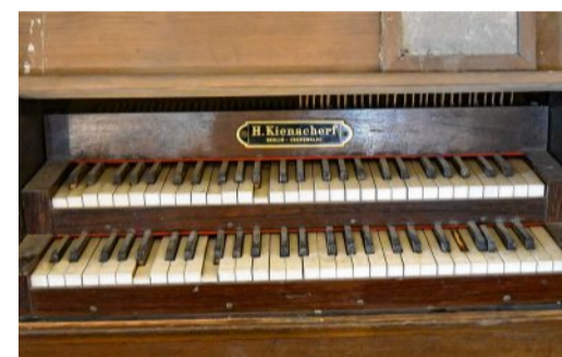
Auch die Orgel kann erst restauriert werden, wenn die Schädlinge beseitigt wurden.