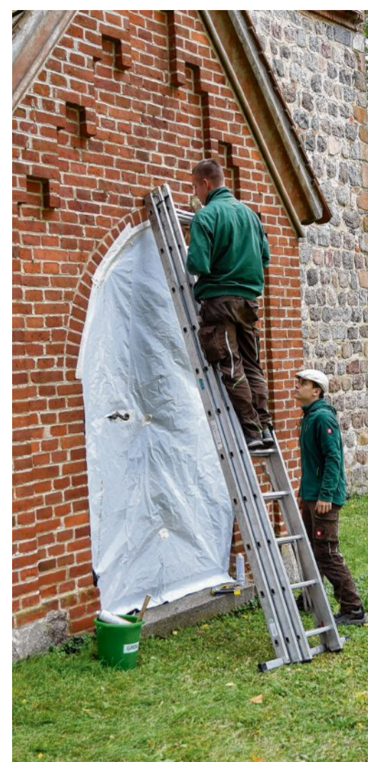
Die Kirche wird abgedichtet, damit das Gas nicht entweichen kann.

„Jetzt sind wir angerückt, um die Begasung durchzuführen.“ Dabei werde ein fluori-