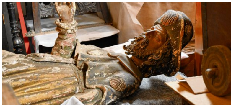
Auch der heilige Jacobus wartet auf die Schädlingsbekämpfung.

Im großzügigen Innenraum des Sakralbaus kann man dann kaum treten, so voll ist es. Aber nicht etwa mit Menschen. Nein. Jede noch so kleine Ecke, Bank oder Freifläche ist mit Gegenständen belegt. Vitrinen, Bilder, Statuen, Sekretäre, Werkzeuge, Schachteln, Stühle, Truhen, ja, selbst ein historisches Spinnrad sind zu entdecken. Ein ganz klein bisschen fühlt man sich wie Howard Carter, als er 1922 das Grab des altägyptischen Königs Tutanchamun entdeckte. Aber das ist es nun doch nicht. Wobei es sich bei den Gegenständen durchaus um Schätze handelt. Nämlich die des Eberswalder Museums. Das stadt- und regionalgeschichtliche Museum