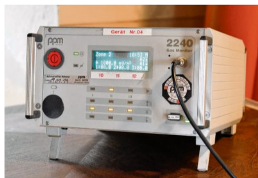
Mit solch einem Gerät wird überprüft, wie das Gas in der Kirche verteilt ist.